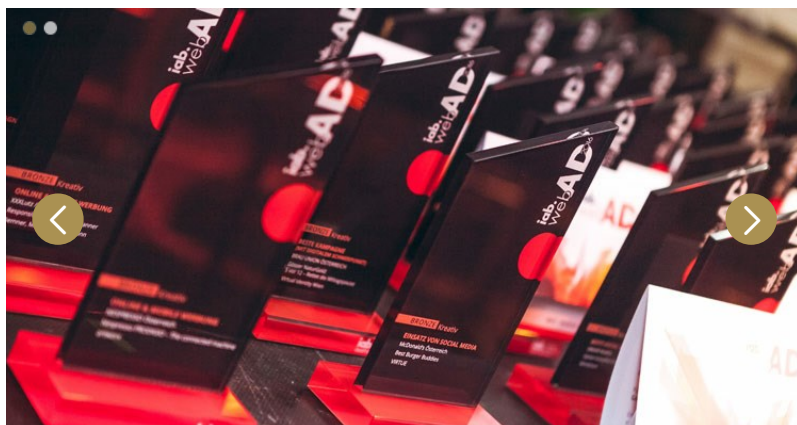
1 von 2 Bildern

Beim renommiertesten Award der Digitalbranche werden die besten, innovativsten und kreativsten Arbeiten in 8 Media- und 12 Kreativkategorien gesucht.